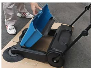
大型のダストコンテナ・17L (取手付・取外し可)