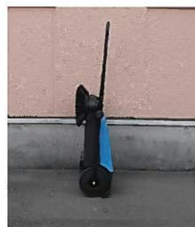
ハンドル折りたたみ (コンパクトな収納)