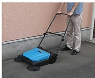
コーナーの清掃 (ダブルサイドブラシ)