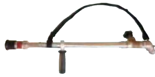
ゲートバルブ式アルミランス+自在散水ノズル 2丁