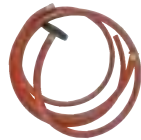
吸水ホース+吸水フィルター