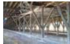
鶏舎での石灰散布