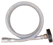
吸水ホース+逆止弁+フィルター