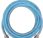
スプレーホース 2本