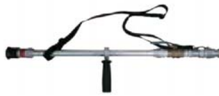
コック式アルミランス+自在散水ノズル