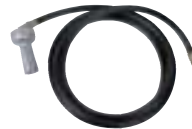
ジェット攪拌機(ホース3m付)