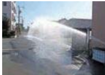
<VJ/WJの解体現場の防塵作業>